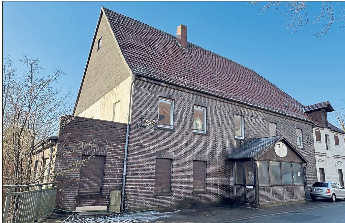
An der Kapellenstraße 23 liegt das Anwesen von Matthias Müller. Derzeit wird es auf Online-Immobilienseiten zum Verkauf angeboten.