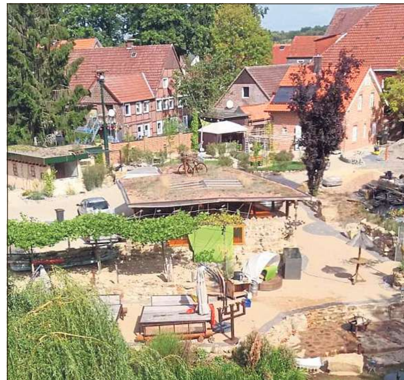
Aus der Vogelperspektive ist der verspielte Außenbereich sichtbar – es gibt einen eigenen Strand am Axtbach.