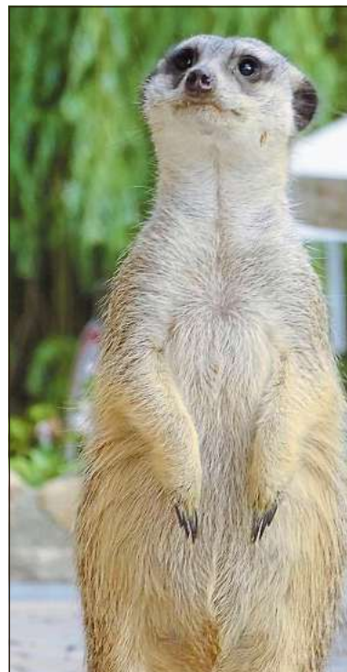
Die neuen Eigentümer bekommen die Erdmännchen als Mitbewohner.

bereit, dabei wird auf die alte Kneipe vor dem Gelände angespielt. „Der ehemalige Gasthof mit vorgelagerter Brennerei direkt an der Straße ist ein Unikat und teilweise noch ursprünglich erhalten. Beim Betreten der Räume fühlen Sie, wie das Leben hier früher pulsiert hat. Das Gebäude befindet sich nicht unter Denkmalschutz, sodass ein Umbau frei geplant werden kann.“ Wie viel Wohnraum in dem Gasthaus geschaffen werden kann, ist der Anzeige nicht zu entnehmen. Auf Nachfrage teilt das zuständige Maklerbüro mit, dass der Gasthof „viel Potenzial“ hat.