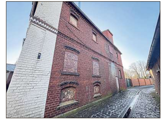
Neben dem alten Gasthof führt ein kleines Pättchen zum Tor des Anwesens.