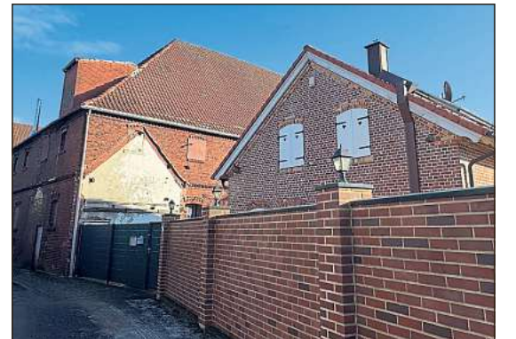
Veräußert wird nicht nur der Gasthof, sondern auch das Anwesen dahinter.